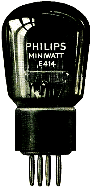
\frac{3}{4} nat. Gr.

Die E 414 wurde für Transformatorverstärkung und besonders für jene Verstärker entworfen, in denen normale Röhren wegen Selbstklingens Schwierigkeiten ergeben. Diese Erscheinung tritt z.B. bei Mikrophonverstärkern öfters auf. Die Verwendung des PHILIPS N.F.-Transformators Nr. 4003, der in Verbindung mit dieser Röhre eine 42-fache, gleichmässige Verstärkung ergibt, wird sehr empfohlen.