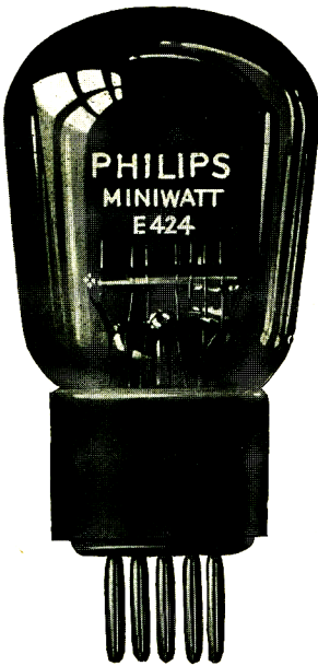
\frac{3}{4} nat. Gr.

Die E 424 wurde besonders für N.F.-Transformatorverstärkung entworfen.